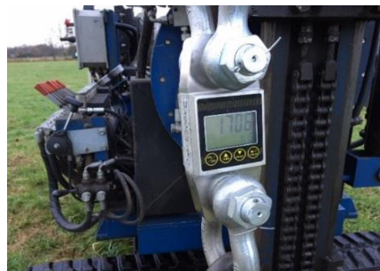
Test af jordskruer med træk vægt